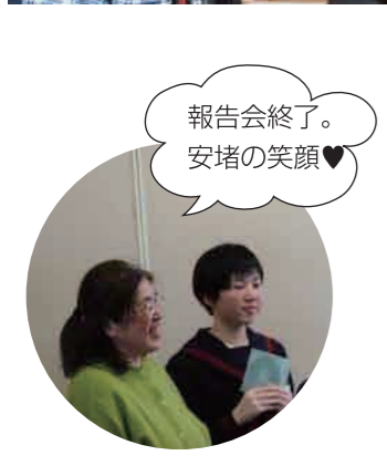
報告会終了。 安堵の笑顔♥