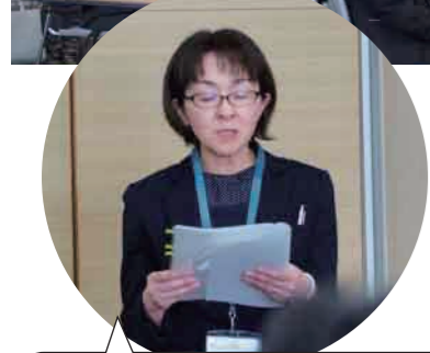
司会・進行を務めていただきました。 ありがとうございます。