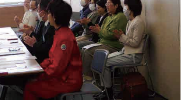
リハーサル中！ 緊張感が伝わります!! ドキドキ♥