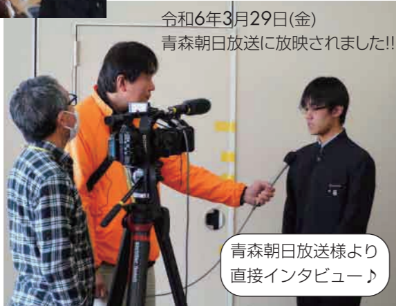
青森朝日放送様より 直接インタビュー♪ 令和6年3月29日(金) 青森朝日放送に放映されました!!