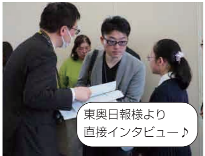
東奥日報様より 直接インタビュー♪ 令和6年3月30日(土) 東奥日報に掲載されました!!