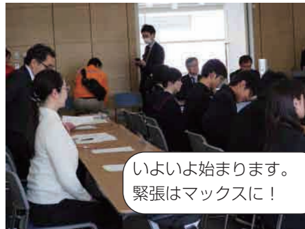
いよいよ始まります。 緊張はマックスに！