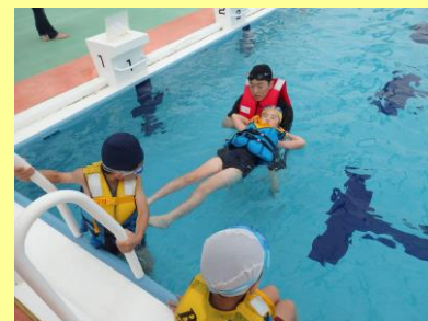
ライフジャケットを着て浮いてみました。