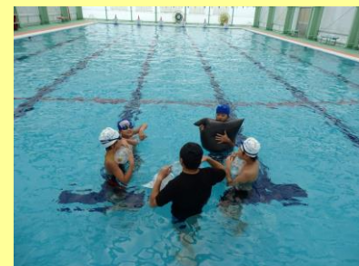
ペットボトルを使って浮く練習