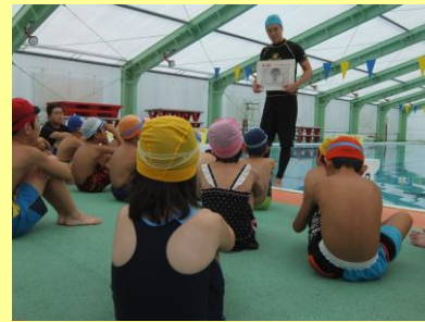
離岸流の学習の様子

9月12日(土)、「海の安全 大研究」を開催しました。 講師：南部町名川B&G海洋センター