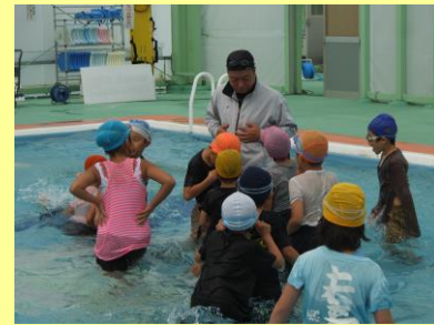
着衣泳を体験しました。