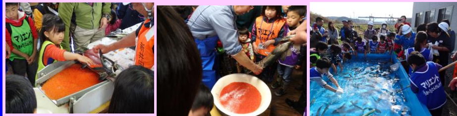
採卵作業の様子 受精作業の様子 ヤマメの掴み取り体験

11月3日(火)、「サケ増殖」と「水産市場」の大研究を開催しました。 「サケ増殖」については、新井田川漁協の施設内を見学しながらサケの孵化から成長するまでの過程と、採卵・受精作業体験し、水産資源を安定的に確保するための取り組み(増殖事業)を学習しました。