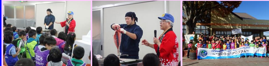
サケ調理方法の実演 八食センター前で記念撮影

また、「水産市場」を見学することで、放流された魚が漁獲され、流通を経て販売・消費されるという、水産業のサイクルについても学習しました。